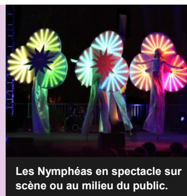
Les Nymphéas en spectacle sur scène ou au milieu du public.