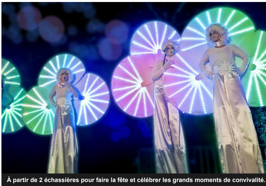
À partir de 2 échassières pour faire la fête et célébrer les grands moments de convivialité.