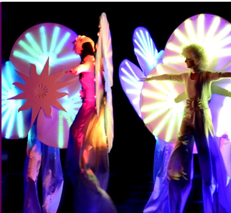
Un tableau « vivant ».